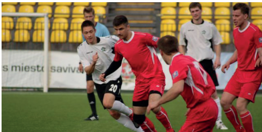
Fragment spotkania „Polonii” Wilno z „Baltija” Panevėžys (Poniewież) na stadionie LFF (dawniej „Vetra” Wilno)