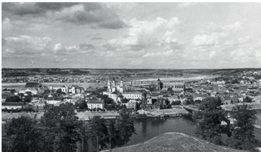
Widok na przedwojenne Kowno. Źródło: NAC – Sygnatura: 1-E-9548

Początki zorganizowanego sportu na Litwie związane są z historią PKS „Sparta” Kowno. Kowno to obecnie drugie co do wielkości miasto Republiki Litewskiej. Sto lat temu było nadniemeńskim grodem granicznym, przez który odbywał się wjazd na tereny byłego Królestwa Kongresowego. W tym mieście Polacy stanowili wtedy nieznaczną większość mieszkańców. Jeszcze w 1919 roku, gdy powstawała – m.in. przy pomocy Niemiec – przedwojenna Republika Litewska, Polacy zdobyli większość w tamtejszej radzie miejskiej. Lecz powoli zarówno proporcje narodowościowe, jak i znaczenie Polaków na tych terenach zmieniały się.