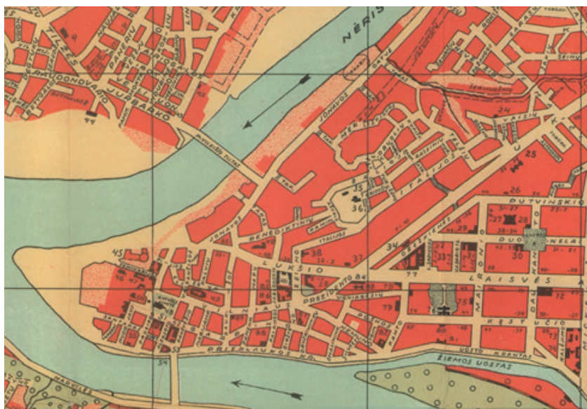
Stadion „Makkabi” Kowno, gdzie niektóre spotkania rozgrywała „Sparta”.