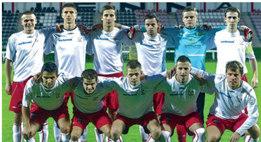
Drużyna „Polonii” Wilno przed spotkaniem w Warszawie przy ul. Konwiktorskiej 6

Przed pierwszym gwizdkiem sędziego publiczność uczciła minutą ciszy pamięć Tadeusza Gebethnera z okazji przypadającej w tym dniu 68. rocznicy jego śmierci. Następnie na stadionie prawie tysięczna rzesza warszawian oraz grupa kilkunastu kibiców z Wilna odśpiewała wspólnie „Rotę” oraz „Mazurek Dąbrowskiego”.