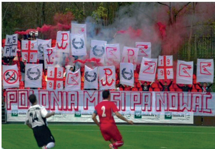
Fragment dopingu grupy kibiców „Polonii” Wilno podczas meczu z FK Siliute w 2023 r.